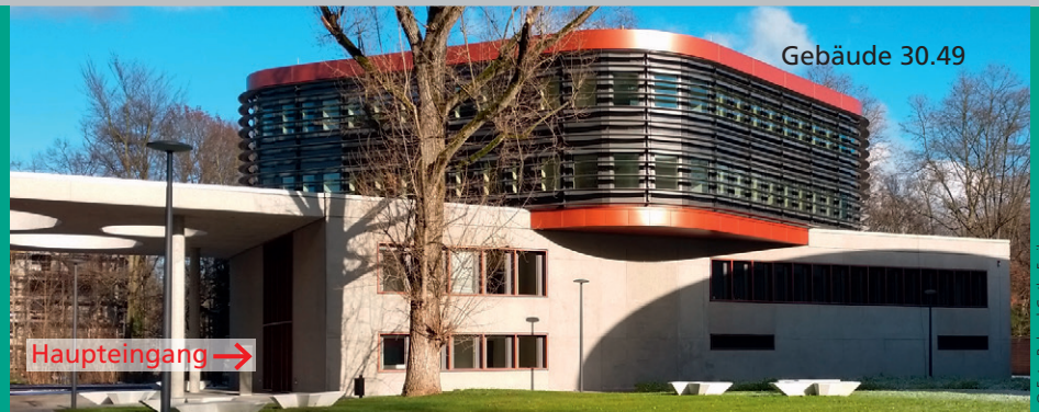
Fraunhofer IWM, MikroTribologie Centrum \mu TC.

EINE KOOPERATION VON FRAUNHOFER IWM UND KARLSRUHER INSTITUT FÜR TECHNOLOGIE KIT IAM